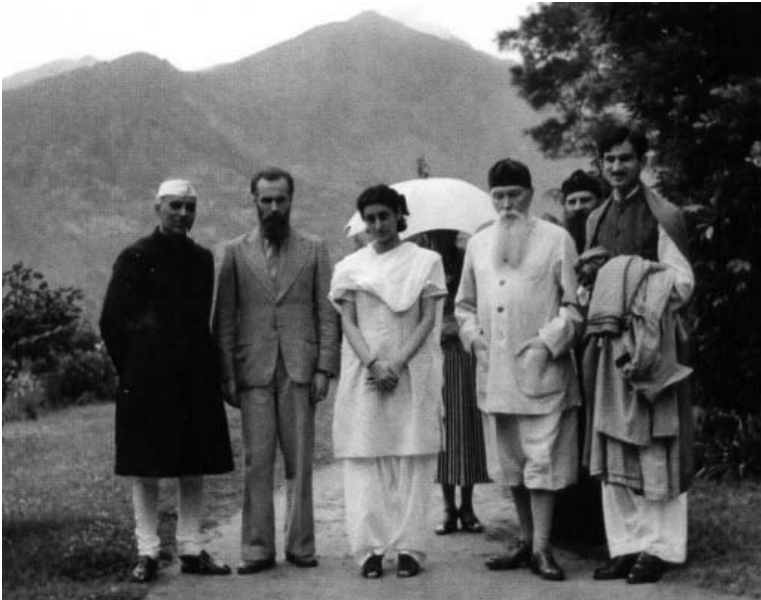
Джавахарлал Неру, С. М. Реріх, Індіра Ганді, О. І. Реріх (під зонтом), М. К. Реріх у Кулу (зліва направо). 1942

Продовжуючи в живопису традиції свого великого батька, М. К. Реріха, Святослав Миколайович пішов своїм власним шляхом. У його роботах немає ні тіні наслідування. У кожного з художників, батька і сина, свій стиль і своя унікальна техніка виконання. Крім портретного, С. М. Реріх звертається до пейзажного, епічного, жанрового та символічного живопису і в усьому проявляє себе як віртуозний майстер і натхненний експериментатор. «У картинах Святослава помічаємо саме гармонійну напруженість всіх частин картини. Велика якість творів, якщо в неї не вкралася байдужість. <...> Прекрасно, якщо дано в житті цей високий дар, яким все темне, все тяжке перетворюється в радість духу. І як радісно ми повинні вітати тих, хто волею долі можуть вносити в життя прекрасне», – писав М. К. Реріх [2].